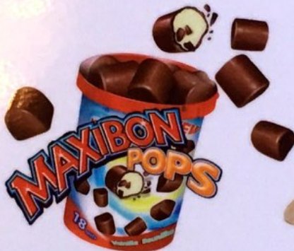
Maxibon Pops Fr. 4.50