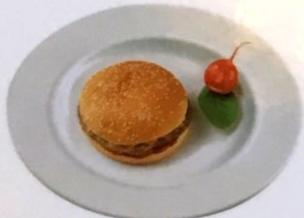
Mr. Bean Hamburger mit Pommes Frites Fr. 14.50