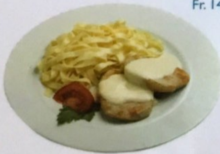
Winnie Pooh Schweinsrahmschnitzel mit Nudeln Fr. 15.50