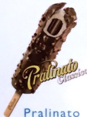
Pralinato Fr. 3.50