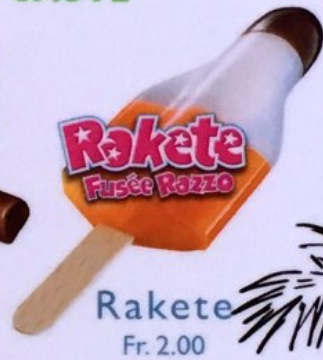
Rakete Fr. 2.00