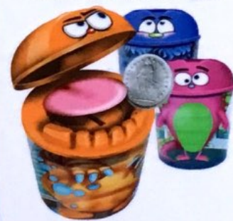
Monster Vanille Glace mit Schokoladenstückli Fr. 6.00