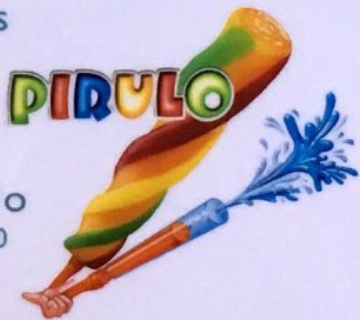
Pirulo Fr. 3.00