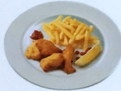
Dinky-Winky Chicken Nuggets mit Pommes Frites Fr. 13.50