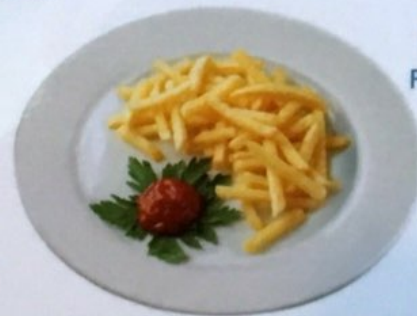
Pommes Frites Pommes Frites mit Ketchup Fr. 7.00