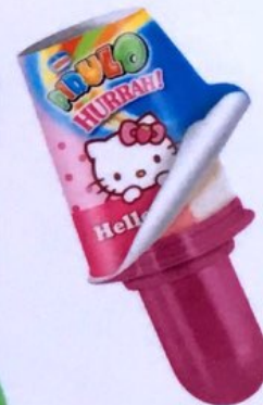
PIRULO Hello Kitty Vanille - Erdbeer, lustige neue Sticker im Stiel zum Spielen Fr. 4.00