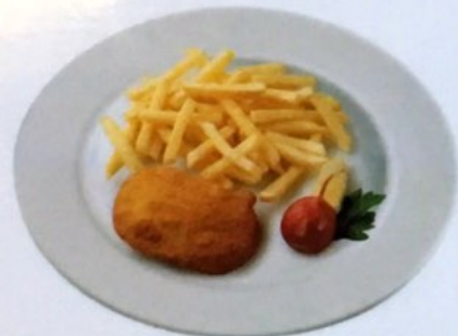
Schnipo Paniertes Schnitzel mit Pommes Frites Fr. 14.50